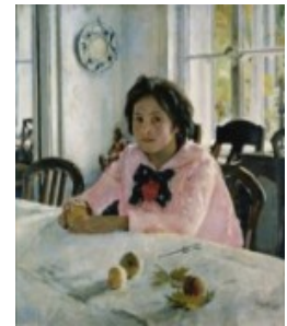
Девочка с персиками