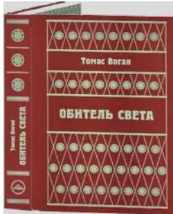
Т.Воган. Обитель Света

Условия рассылки приведены в конце каталога